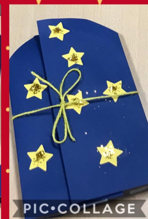
Primaria di Castagnole