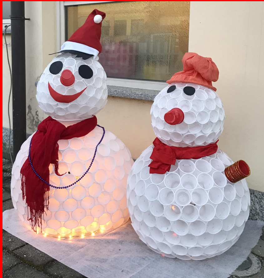
Primaria di Castagnole