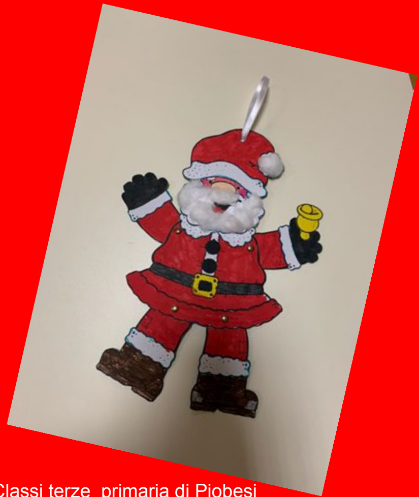
Classi terze primaria di Piobesi