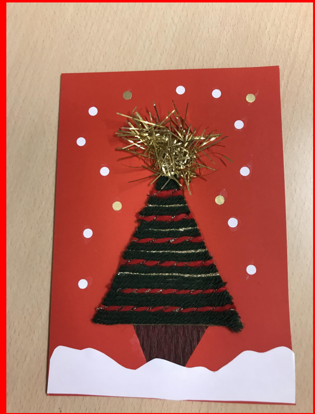
Primaria di Castagnole