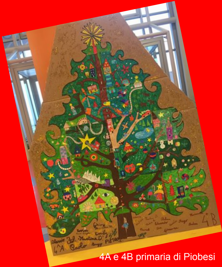
4A e 4B primaria di Piobesi