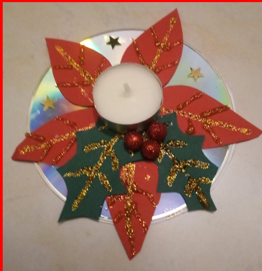
5A e 5B primaria di Piobesi