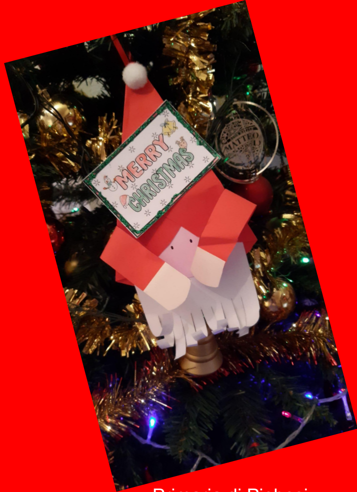
Primaria di Piobesi