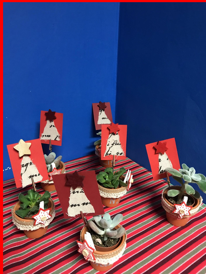
Primaria di Castagnole